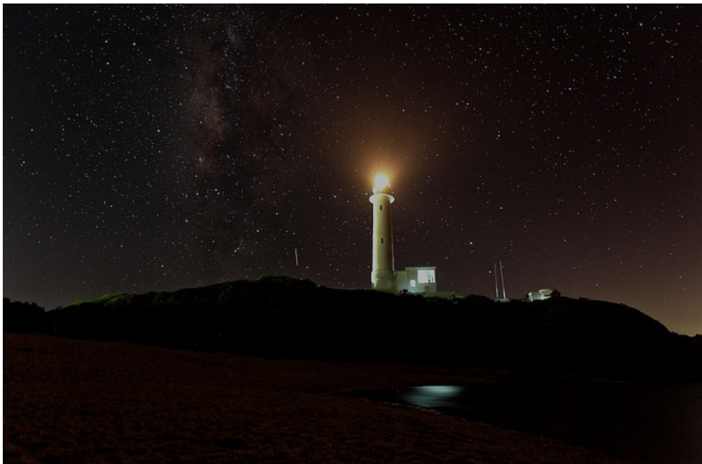
銀河中的綠島燈塔