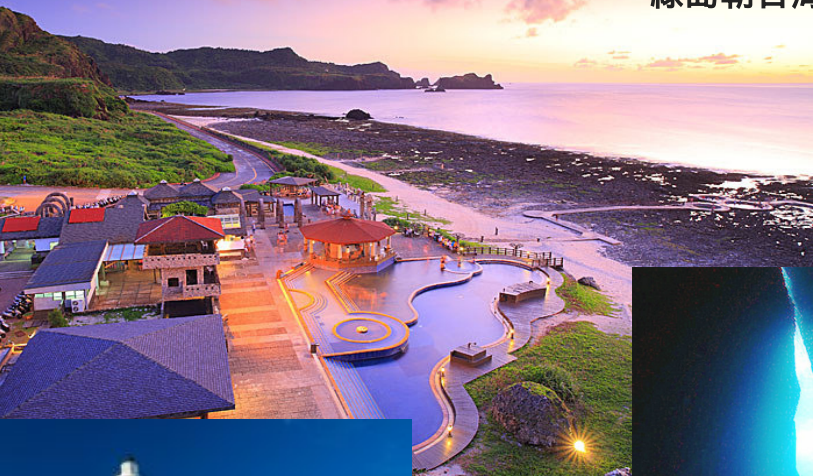
綠島朝日海底溫泉