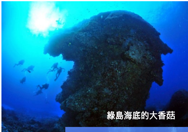
綠島海底的大香菇